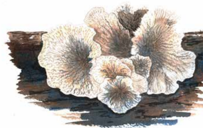
Kantarellmussling Plicatura crispa