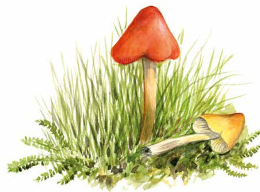
Toppvaxskivling Hygrocybe conica Witch's hat

Fälad är ett sydsvenskt ord för betesmark, och i Munkarps fälad går djuren och betar bland kullar och enbuskar. Området låg bortom byns odlade mark och fungerade som gemensam betesmark till byns djur. Växter som slättegubbe och svinrot visar att delar också kan ha använts som slättermark. Trots fortsatt bete har området långsamt växt igen. Sedan 2017 pågår ett varsamt restaureringsarbete. Genom att röja bort träd och buskar öppnas betesmarkerna upp för att få tillbaka sin forna glans. Men tillräckligt många enbuskar kommer finnas kvar för att både barn och betesdjur ska kunna leka kurragömma bland buskarna.