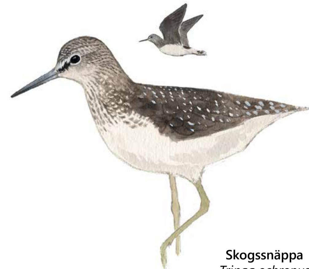
Skogssnäppa Tringa ochropus Green sandpiper

Lösjön i nordvästra delen har sänkts och omges idag av gungfly med vitmossor och starr. Här syns trollsländor som mindre smaragdfläckslända och brun mosaikslända flyga över vattnet. I strandkantens fuktiga ångar spatserar skogssnäppan på jakt efter insekter.