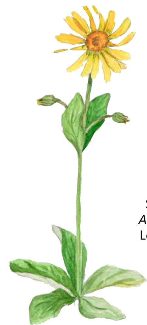
Slättegubbe Arnica Montana Leopard's bane