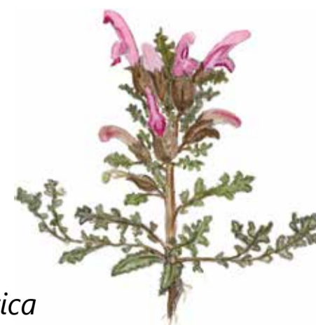
Granspira Pedicularis sylvatica Lousewort

På sensommaren växer små gula och röda svampar i betesmarken. Det är olika arter av vaxskivlingar, en grupp svampar som bara växer i marker som har lång historia av bete, och som inte har gödslats.