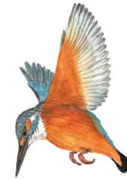
Kungsfiskare Alcedo atthis Kingfisher

Vid den gamla kvarnen måste kanotisterna stanna till för att bära kanoterna. Grillplatsen med bord och bänkar är till för både vandrare och de som kommer vattenvägen. I de fuktiga skogsmiljöerna i den södra delen är det svårt att ta sig fram, här får hackspettar och andra fåglar ensamma rå om skogen.