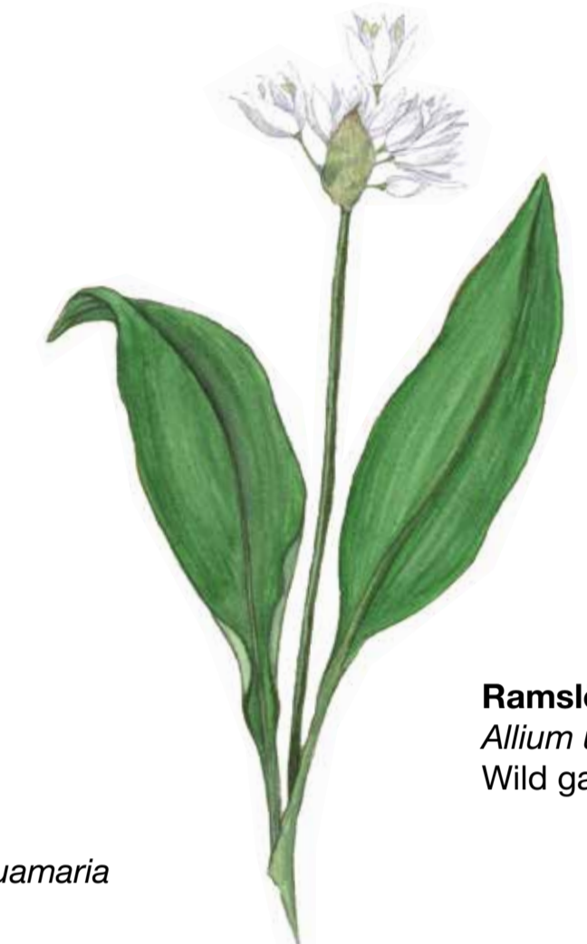
Ramslök Allium ursinum Wild garlic