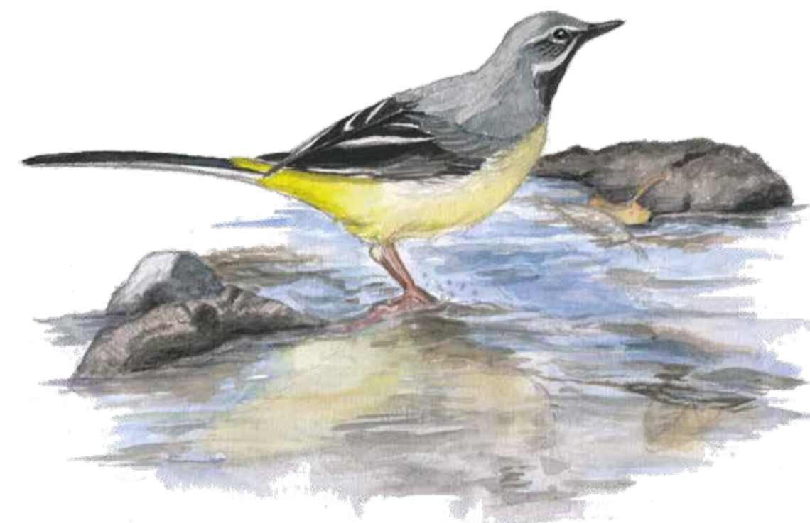
Forsärla Motacilla cinerea Grey wagtail

Den fuktiga alsumpskogen längs ån ska, liksom ädellövs skogen med hassel, ek och ask på sluttningarna, få utvecklas mot naturskogsliknande miljöer. I sluttningen på den nordöstra sidan står den döda almskogen kvar. Här är det bäst att hålla sig till stigen för det är stor risk att de döda träden faller.