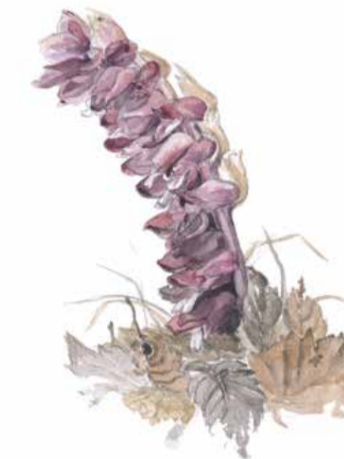
Vätteros Lathraea squamaria Toothwort