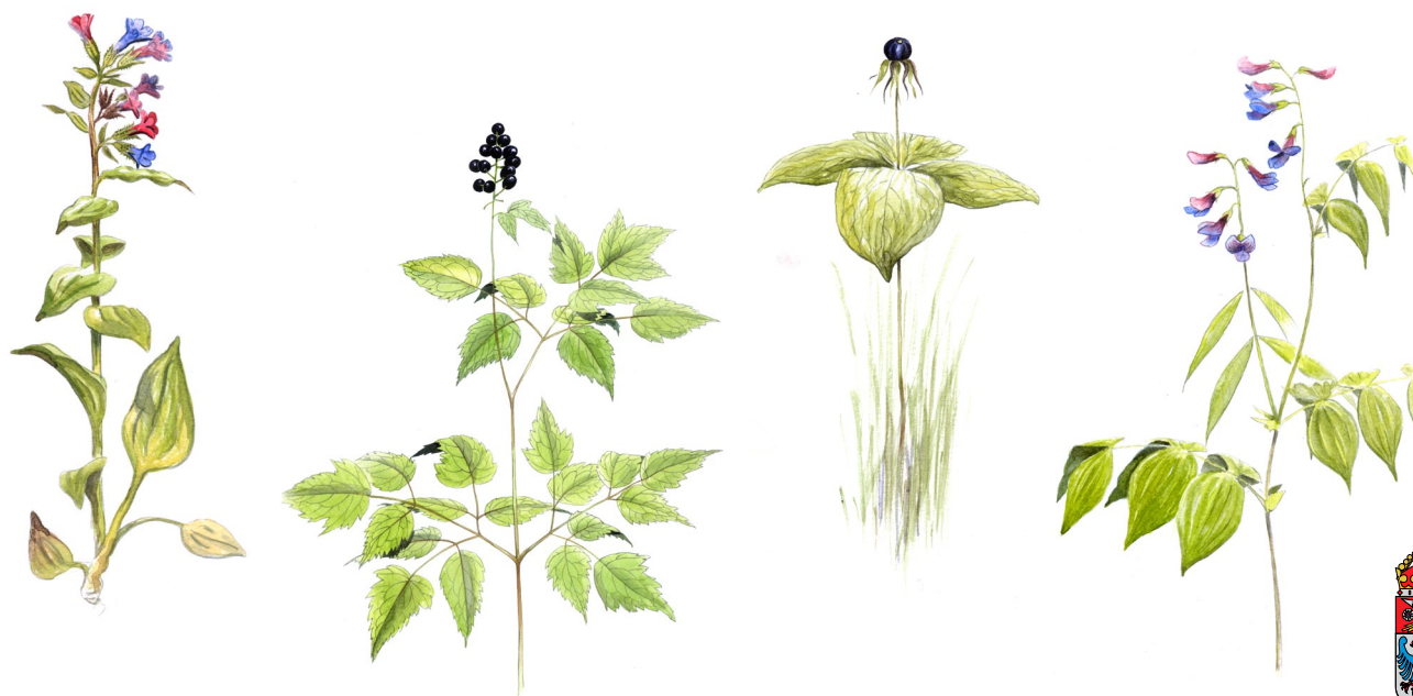
I ravinens trivs örter som (från vänster till höger) lungört, trolldruva, ormbär och vårärt.

Naturreseptet består av gamla ängs- och hagmarker, frodig lövskog och den djupa Runsala ravin. Lövskogen med bl a ek, lönn, asp, lind och ask har utvecklats fritt under lång tid. Här finns gott om liggande döda stammar och grenar. Den förmultnande veden är ett eldorado för sällsynta svampar, t ex kandelabersvamp som växer på kraftigt rötad aspväd.