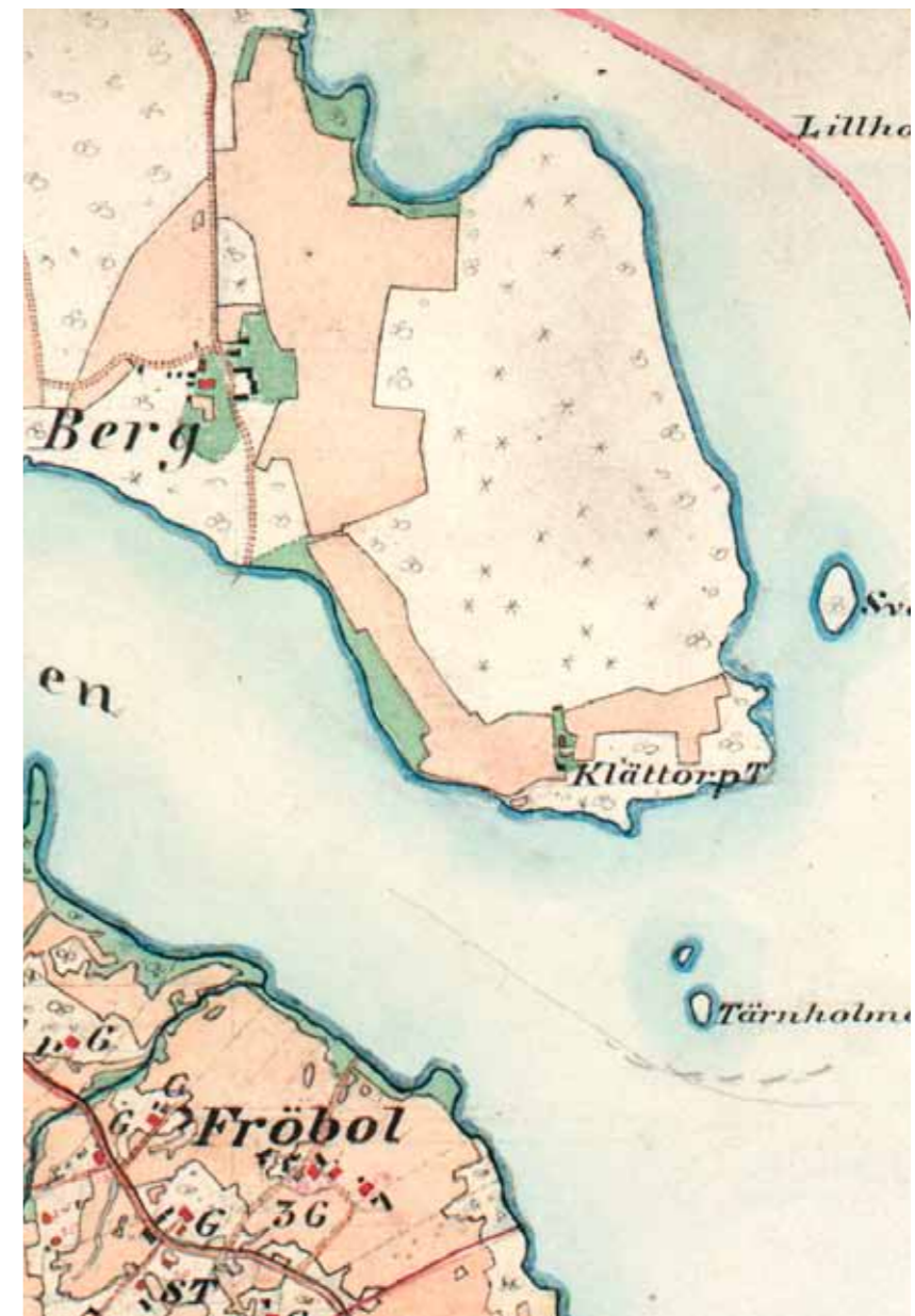
Häradsekonometrisk karta 1883-95

The crofter's holding belonged to the farm Berg, which was owned by the Crown. The crofter leased the holding from the Crown. Most 19th century crofters led a hard life. In addition to farming their own land, crofters were obliged to carry out day work on the main farm in return for the lease.