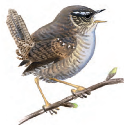
Gärdsmyg ( Troglodytes troglodytes ), en polygam liten tätting. Hanen har flera honor samtidigt.

På grova, höga tallstubbar syns spår av brand i form av svart ved. Bränder var förr en naturlig störning i skogen, storm en annan. Både bränder och stormar har här bidragit till artrikedomen. Den fuktiga östslutningen är ett eldorado av spektakulära mossor, en av dem med det lite lustiga namnet purpurmylia. Den känns igen på den roströda färgen och att bladen är böjda som en uppslagen bok.