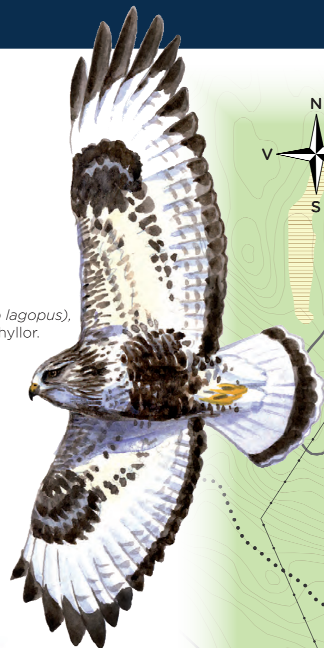
Fjällvråk ( Buteo lagopus ), häckar på klippfyllor.