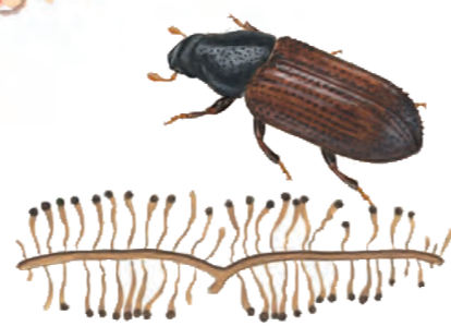
Mindre mörghorre ( Tomicus minor ) med gnagspår under barken.