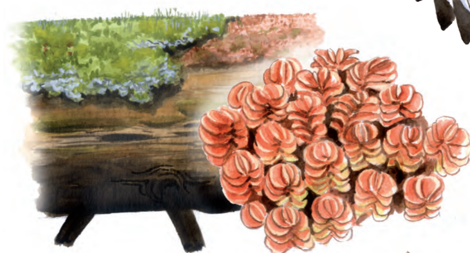
Purpurmylia ( Mylia taylorii ) vill ha det riktigt fuktigt.