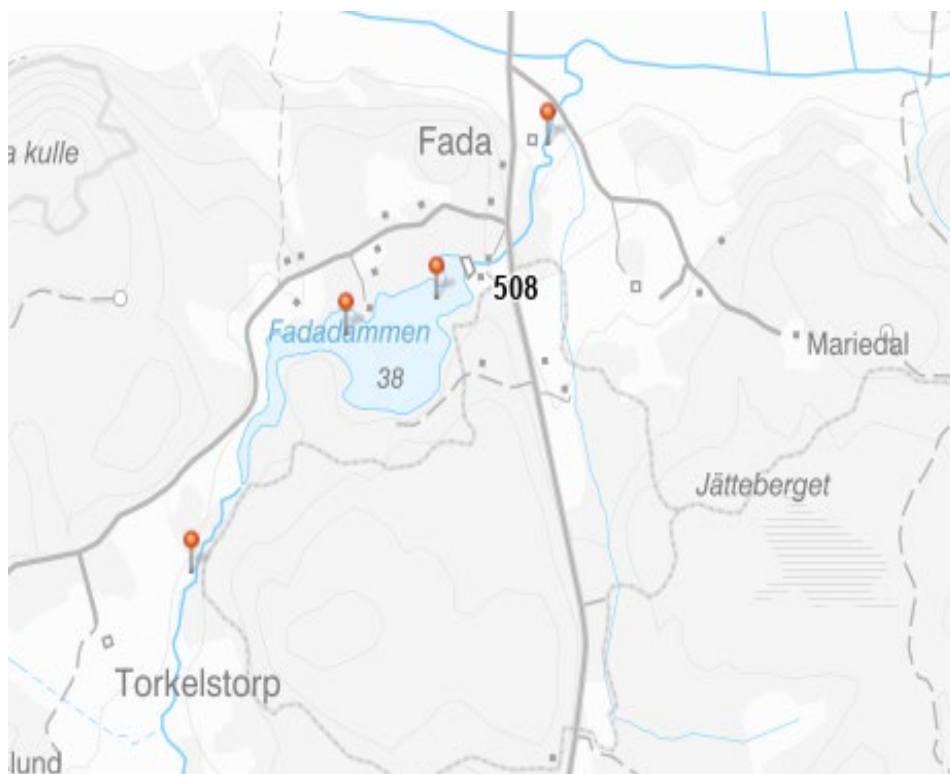
Figur 1. Kartan visar föreslagna provtagningsplatser för E-DNA inom fadabäckens avrinningsområde.