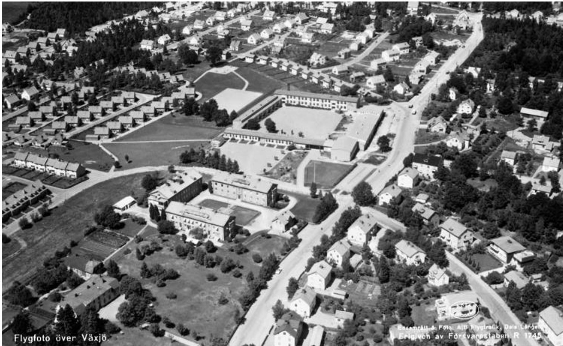
Flygfoto över Växjö.

Ulriksbergs folkskola är säkerligen Sveriges elegantaste skolbyggnad i luftig haciendastil och mjukt insmugen i terrängen nordväst om staden, franska fönster i klassrummen ut mot trädgårdens gräsmattor, handtryckta gardiner och konst. (Växjöbladet 501028)