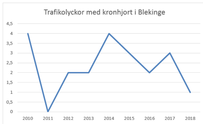
Diagram 1.1

Viltolyckor med kronvilt väldigt få i Blekinge och måste sättas i relation till totala antalet årliga viltolyckor som idag är ca 1300 st. I dagsläget ser vi ingen anledning att göra någon direkt anpassning i förvaltningsplanerna för kronhjort med avseende på viltolyckor. Över tiden kan såklart situationen förändras med en växande stam och måste då på nytt utvärderas.