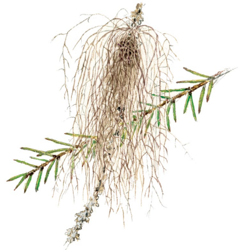
Violettgrå tagellav. Illustration: Lennart Molin

Tack vare områdets storlek, blandningen av naturtyper och de relativt orörda skogarna, finns många olika arter av växter och djur här. Bland de skyddsvärda arter som finns här kan nämnas vedtrappmossa, aspgelélav, ringlav, violettgrå tagellav, gränsticka och stjärntagging. Bland fåglar och däggdjur som förekommer kan nämnas slaguggla, tretåig hackspett, lo och varg.