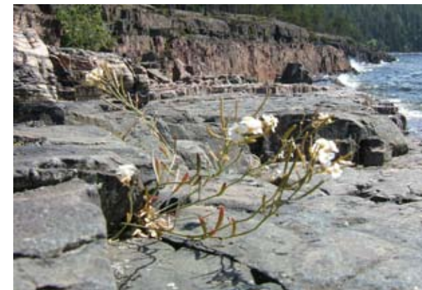
Strandtrav ( Cardaminopsis petraea )

Länsstyrelsen Västernorrland © Bakgrundskartor Lantmäteriet, dnr 106-004/188-Y