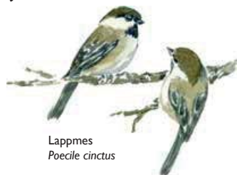
Lappmes Poecile cinctus

Här ska granskogarna med garnlav, osttickor och tretåiga hackspettar få sköta sig själva.