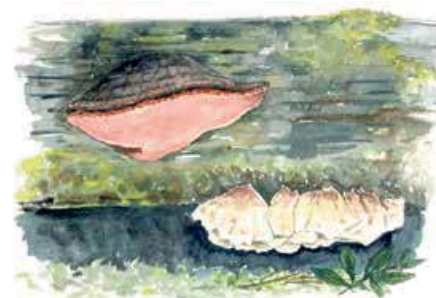
Rosenticka Fomitopsis rosea och lappticka Amylocystis lapponica

I Njakafjäll kan man möta både ren och älg och kanske hitta ett gammalt björnide. Varje vinter spåras järv och lodjur i Njakafjäll. Har man tur visar sig taigans stannfåglar, lavskrika, tretåig hackspett och lappmes, under ett besök.