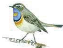
Blåhake Luscinia svecica