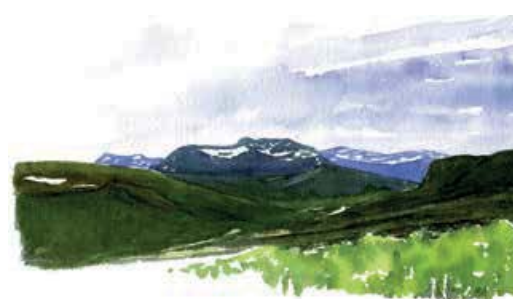
Utsikt mot Vindelälvens dalgång norr om Ammarnäs