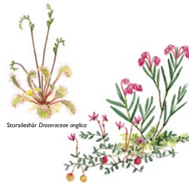
Storsileshår Droseraceae anglica

I reservatets västra del finns ett 370 meter långt fångstgropssystem med 12 fångstgropar. Idag är groparna en halvmeter djupa. När groparna brukades var de rejält djupa, troligen upp emot 2 meter. Fångstgropar användes för att jaga älg från stenåldern fram till år 1864, då de förbjöds.