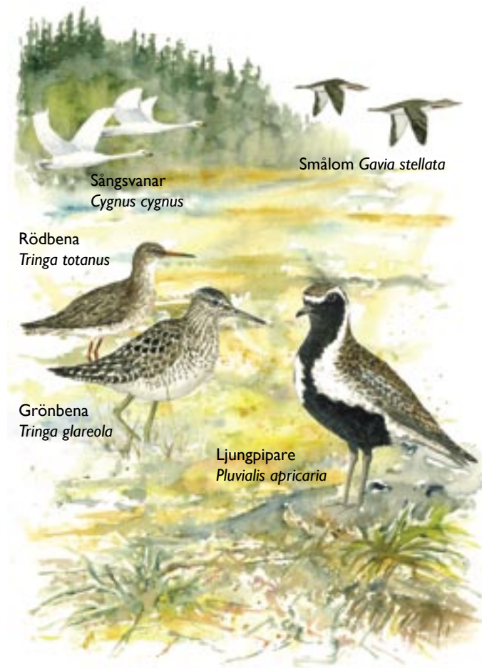
Sångsvanar Cygnus cygnus

Omslagsbild: Torsmyran sedd från rastplatsen vid E4. Skvattram Rhododendron tomentosum i förgrunden.