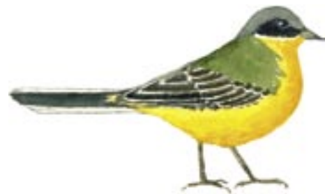
Gulärta Motacilla flava

Myren har också intressant insektsfauna. Man har hittat 16 olika jordlöpare, 27 olika vattenskalbaggar, 5 arter vattenskinbaggar och 8 troll- och flicksländor. Bland de 24 dykarna kan särskilt den rödlistade dykarbaggen Laccophilus biguttatus nämnas. Denna hoppande dykare är mycket ovanlig i Sverige, men ändå spridd över hela norra halvklotet.