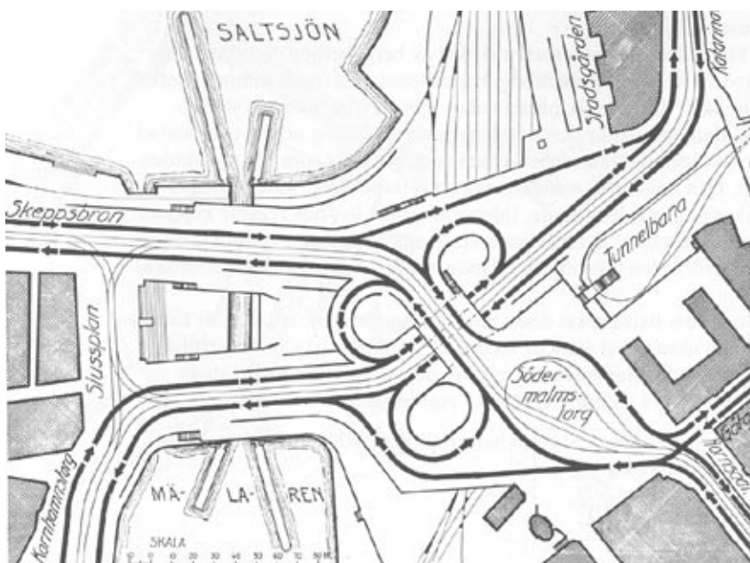
Schematisk, slutlig planlösning av Slussen ritad av arkitekt Tage William-Olsson. Platsens trafikproblem ansågs löst tack vare det så kallade klöverbladssystemet. Planlösningen visade sig också klara övergången från vänster- till högertrafik år 1967.

och Södermalm. I nuvarande Slussenanläggning markeras vattenpassagen som en valvform tack vare nerfarts-