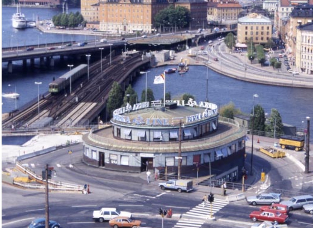
Kolingsborg, mitt i ett av Slussens "klöverblad". Utsikt mot Centralbron, Riddarholmen och Gamla stan.

ramper mot kajplanet även mot söder, på både östra och västra sidan av Slussenapparaten. Detta är synligt när man närmar sig från Stadsgården respektive från Kornhamnstorg. Från Söder Mälarstrand är Slussenområdet skymt av järnvägsbro, Centralbro och tunnelbanebro tills man är alldeles intill. Från Skeppsbron respektive Katarinavägen/Södermalmstorg domineras synfältet av trafikytorna med Södra Bergen respektive vattenytorna i fonden.