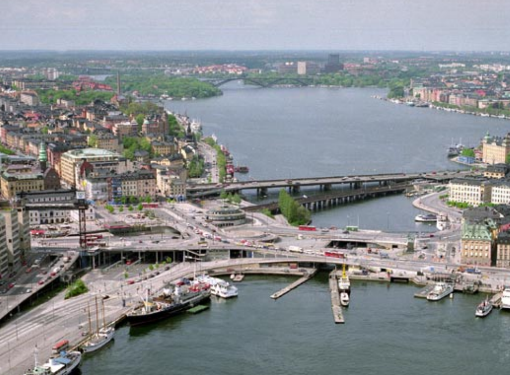
Slussen från ovan.