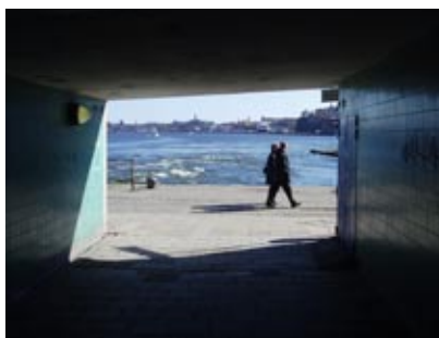
Utsikt mot Saltsjön.

Slussen är ett tekniskt koncept som har gett en hållbar lösning på trafikfrågorna i 70 år. En kvalitet i 30-talets trafikapparat är dess tydliga form med