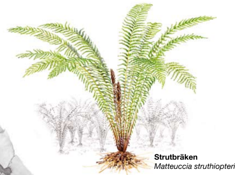
Strutbräken Matteuccia struthiopteris

I Axelstorpsbäcken finns larver av den sällsynta nattsländan Odontocerum albicorne , som bygger sitt hus av små sandkorn. Husbyggande nattsländelarver brukar kallas husmaskar och är strömstarens favoritföda.