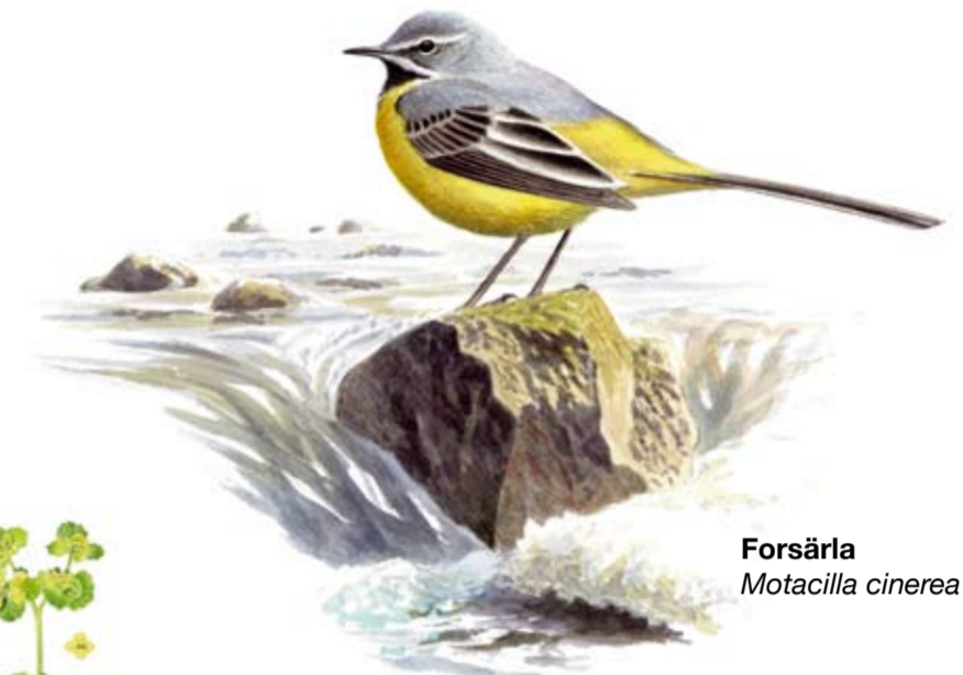
Forsärla Motacilla cinerea