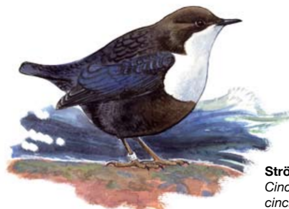
Strömstare Cinclus cinclus