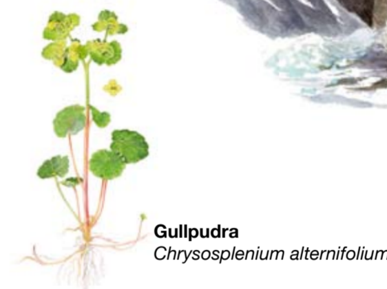
Gullpudra Chrysosplenium alternifolium