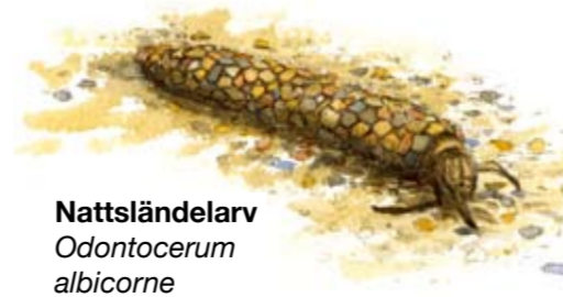
Nattsländelarv Odontocerum albicorne

I Axelstorpsbäcken finns larver av den sällsynta nattsländan Odontocerum albicorne , som bygger sitt hus av små sandkorn. Husbyggande nattsländelarver brukar kallas husmaskar och är strömstarens favoritföda.