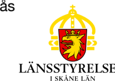
LÄNSSTYRELSEN I SKÅNE LÄN

Förvaltare: Länsstyrelsen i Skåne län. www.m.lst.se