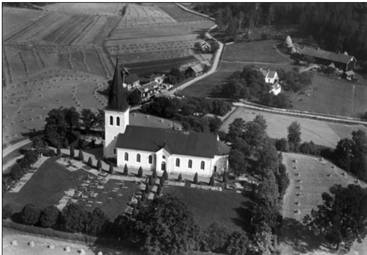
Hannäs kyrka 1935.

Den äldsta kända kyrka i Hannäs var en träkyrka, uppförd under 1100- eller 1200-talen. Den ersattes på 1400-talet av en stenkyrka med långhus, kvadratisk kor och sakristia i norr. Stenkyrkan revs i samband med att den nuvarande kyrkan uppfördes 1885. Efter flera års stridigheter om var den nya kyrkan skulle byggas, skänkte ägarna till socknens största gård, Grävsätter, en tomt belägen ca 1 km norr om den äldre kyrkan.