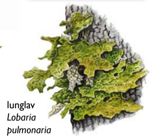
lunglav Lobaria pulmonaria

I reservatet lever många organismer med höga krav på sin livsmiljö.