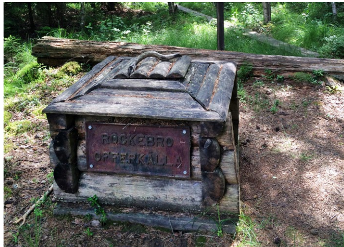
Rockebro offerkälla glänser fortfarande av mynt. Inte många vågar stjäla dem. Evig olycka är straffet. (t h)

I Rockebro, mellan Laxå och Askersund, har inlandsisen skapat ett spännande och märkligt landskap med åsryggar, kullar och sänkor. Flera dödisgropar finns i området. Dessa uppkom då isblock bröts loss från huvudisen och bäddades in i grusavlagringar. När de senare smälte bildades stora gropar. Den största gropen är i dag en sjö – Gropsjön. Andra är vattenfyllda vissa tider av året.