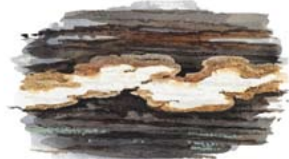
Fläckporing Antrodia albobrunnea

Fläckporing, dvärgbägarlav och raggbock är alla exempel på arter som är knutna till gamla tallskogar. Fläckporing, som är ovanlig i de flesta av länets gamla skogar, är något av en karaktärsart i Ensjölokarna. • The fungus Antrodia albobrunnea , the parasite cup lichen and the longhorn beetle Tragosoma depsarium are all examples of species that are associated with old pine forest. Antrodia albobrunnea , which is rare in most of the country's old forests, is a particularly distinctive species for Ensjölokarna.