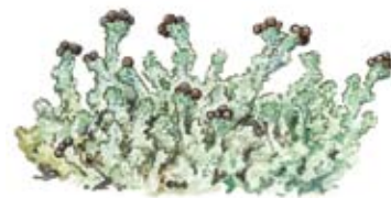
Dvärgbägarlav Cladonia parasitica

Branden gynnar lövträd och tall på bekostnad av gran. Inslaget av tall blir större eftersom tallen, med sin tjocka bark