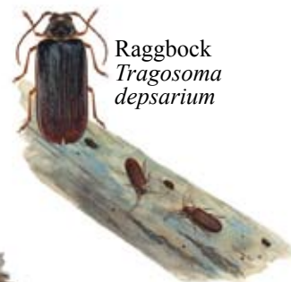
Raggbock Tragosoma depsarium