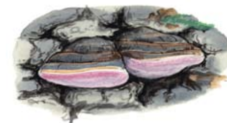
Rosenticka Fomitopsis rosea

Från Ånge: Kör väg 83 söderut. Cirka 8 km söder om Mellansjö svänger du av åt höger, mot Ensjölokarnas naturreservat. Följ sedan skyltningen.