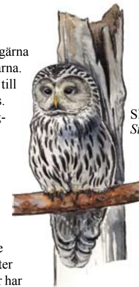
Slaguggla Strix uralensis

Slaguggla häckar gärna i ihåliga tallhögstubbar, så kallade skorstenar. Dessa avbrutna trädstammar har knäckts på mitten där de försvagats av svampangrepp och uthackade bohål.