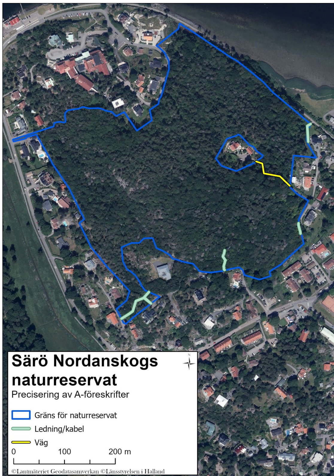
Karta 1: Kartan visar var i området vissa undantag från A-föreskrifterna gäller.