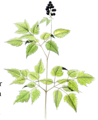
Trolldruva Illustration Jonas Lundin

I en gammal skog får träden leva och dö i sin egen takt. Ibland möblerar även brand, vind eller insekter om i landskapet. Här finns därför gott om döda träd, huller om buller på marken. Skräpigt tycker kanske den som är van vid sin välskötta trädgård. Desto gladare är alla vedlevande insekter, svampar och mossor som har svårt att klara sig i våra modernt brukade skogar.