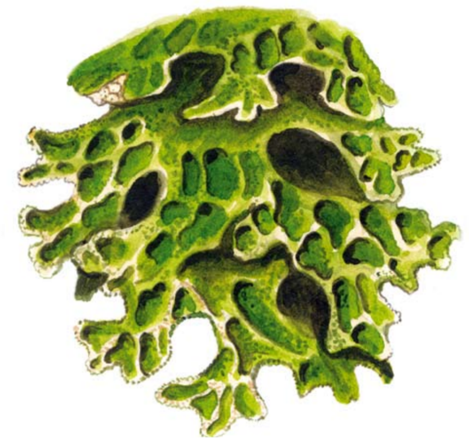
Lunglav Lobaria pulmonaria

Lunglav är en av de största lavarna i Sverige. I gynnsamma lägen blir den flera decimeter i diameter. Vid regn eller hög luftfuktighet är laven vackert mörkgrön.