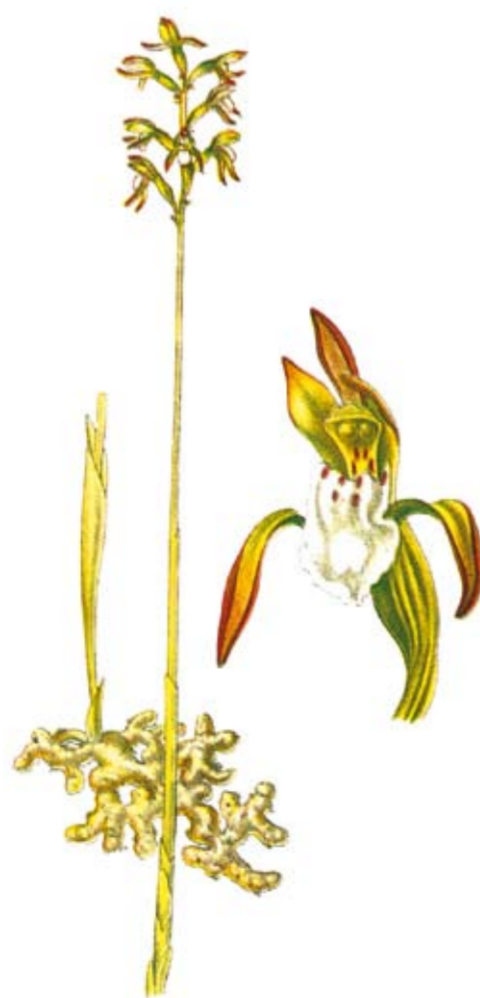
Korallrot Corallorhiza trifida

Längs bäckarna är växtligheten frodig. Här växer bland annat den högresta tortan och orkidéerna tvåblad, korallrot, knärot och spindelblomster.