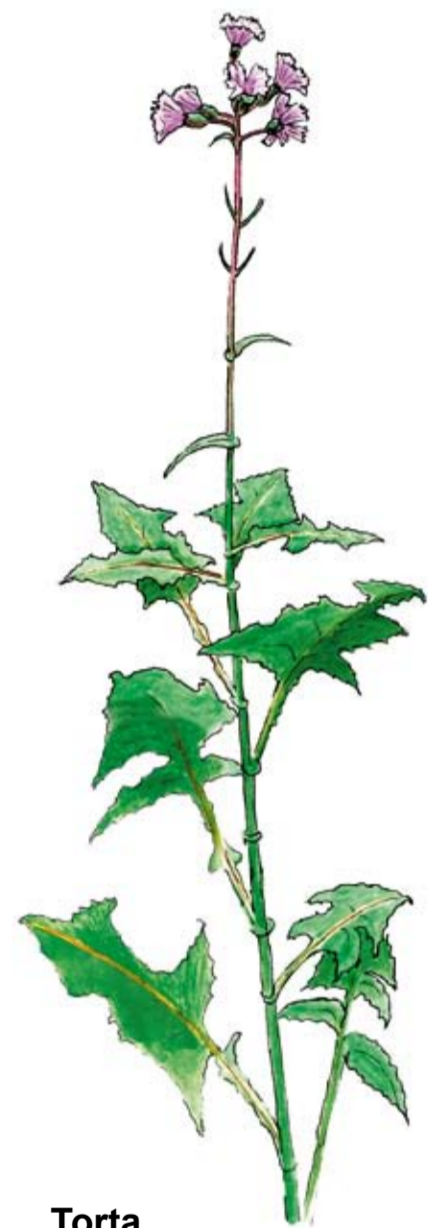
Torta Cicerbita alpina

Tortan blommar i juli–augusti och kan bli upp till två meter hög. Den trivs bäst på fuktig mark, t.ex. kring bäckar.