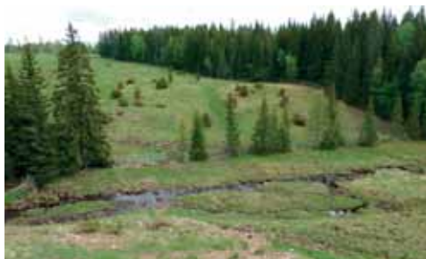
I Bölsåns branta ravin är blomsterprakten stor under försommaren.

Bölgjande ängsbackar, dungar med lövträd, blomsterrika kärrmarker. Det här är ett landskap som var vanligt i Dalarna för hundra år sedan, men som i dag bara går att finna på ett fåtal platser.