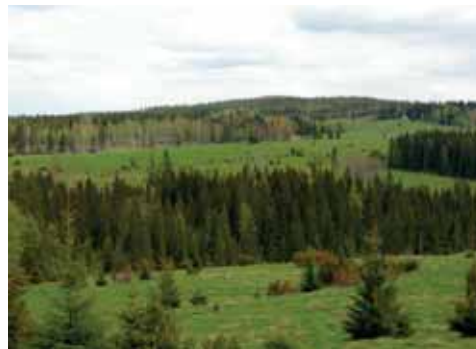
Böle-Fallsbjörken bjuder på vidsträckta vyer.

Här släpps varje sommar stora flockar av hästar och ungnöt ut på sommarbete, en tradition som sträcker sig tillbaka ända till 1920-talet. Då köpte Leksands Avels- och Betesförening in mycket av markerna och än idag står de för skötseln och ser till djuren. Detta värdefulla arbete under snart hundra år har bevarat dessa unika marker.