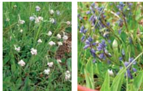
Ett axplock av alla de arter du kan hitta i Böle-Fallsbjörken. Kattfot, rosettjungfrulin, scharlakansvaxskivling och åkervädd.

Böle-Fallsbjörken är också ett paradiset för den växtintresserade. Blomsterprakten är som störst i Bölsåns branta ravin. Här finns fortfarande alla de ängsblommor som förr täckte stora delar av området, som fältgentiana, brudsporre, darrgräs, vildlin, pillerstarr, blåsuga, knägräs, slåtterfibbla, rosettjungfrulin och låsbräken. Karaktärsart i ravinerna är den lilla rosa majvivan. Luktarna på den kommer du känna att lukten påminner om häst. På hösten kan du också hitta många spännande svampar, till exempel flera arter vaxskivlingar, aprikosfingersvamp och den sällsynta purpurbrun jordtunga.