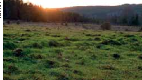
Markernas unika karaktär bevaras genom bete.