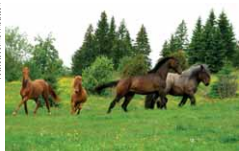
Spring i benen! Varje sommar släpps hästar och ungnöt ut på bete.