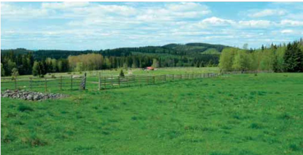
Bölgjande ängsbackar och dungar med lövträd, Böle-Fallsbjörken är som gjort för en picknick.