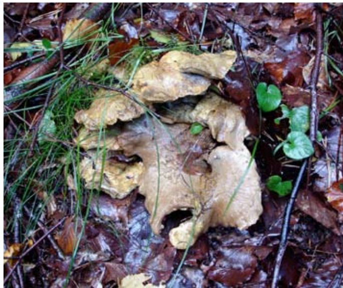
Grönticka i väta.