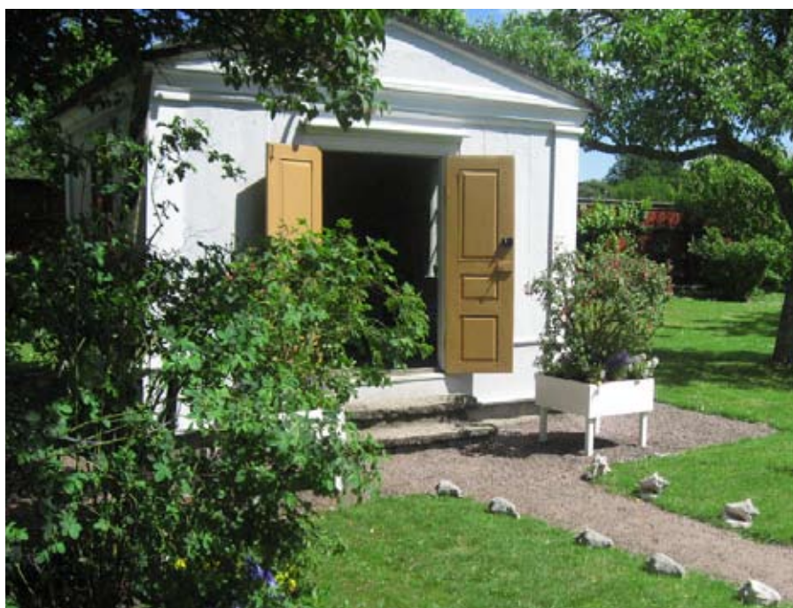
Lusthuset i Krusenstiernska trädgården i Kalmar.

Vi vill uppmuntra dig att delta i kulturmiljöarbetet! Eftersom arbetet att sköta, tillgängliggöra och informera om vårt kulturarv både kan vara tidskrävande och kostsamt kan du söka bidrag till sådant arbete hos Länsstyrelsen. Läs om vad du kan söka bidrag till, hur du gör din ansökan och hur bidragsprocessen ser ut.