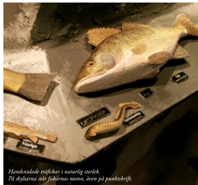
Handsmidade träfiskar i naturlig storlek. På skyltarna står fiskarnas namn, även på punktskrift.

Utställningstexten finns översatt till flera språk. Översättningarna finns att låna i Vätternrummet.