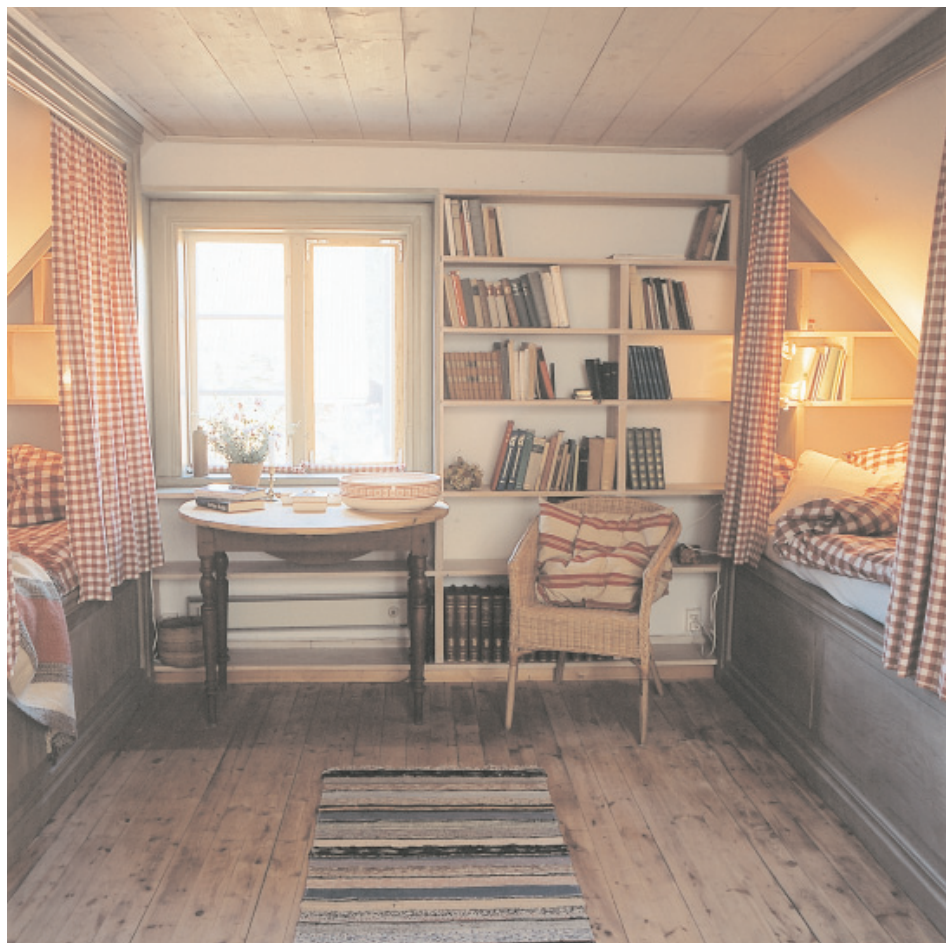
Här ser vi en sovstuga i ett gammalt uthus som inretts med återkommande rödrutiga textilier till enhetligt grå och gråvita snickerier målade med äggoljetempera. Brädgolv och brädtag är klarlackade. Gillsättra, Mörbylånga kommun.

Täckmålade, laserade eller lackade bräder är bra som takmaterial. Synliga bjälkar ger karaktär och bör inte kläs in.