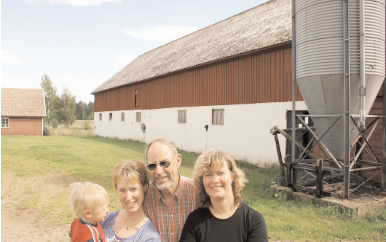
Tre generationer Olsson framför ladugården där en anläggning för bl.a. "grön rehabilitering" planeras.

kombineras med möjligheten att få medicinsk genomgång av en ansluten läkare vilket i sin tur ger legitimitet åt verksamheten.