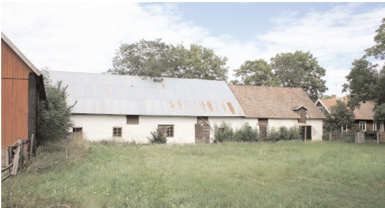
Ladugårdsplanen i Alböke med fr.v. lada, ladugård och stall.

Totalt har man närmare sjuhundra djur och det går åt mycket foder.