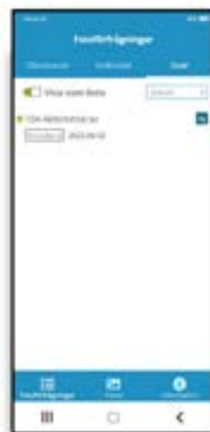
Svar efter gränssökning