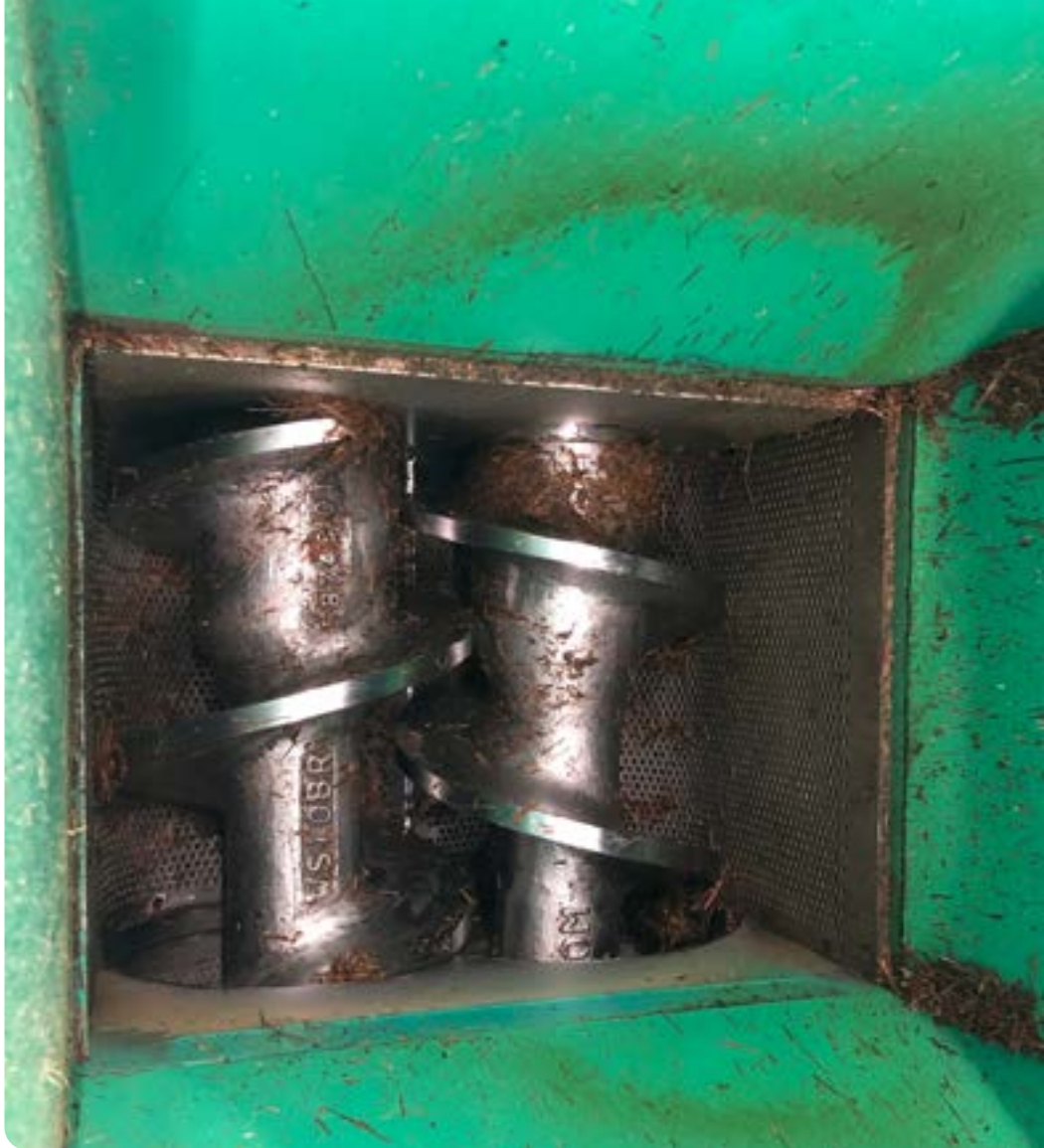
▲ Här pressas den proteinrika juicen ur grönmassan.

För det småskaliga konceptet har erfarenheter och idéer hämtats från demonstrationsanläggningen på Naturbruksskolan Sötåsen. I konceptet är det tänkt att vall processas i bioraffinaderiet som står på gården. En tänkbar kapacitet på anläggningen är cirka 0,5 ton torrsubstans (ts) per timme. Om de använder både färsk vall och ensilerad vall är en an-