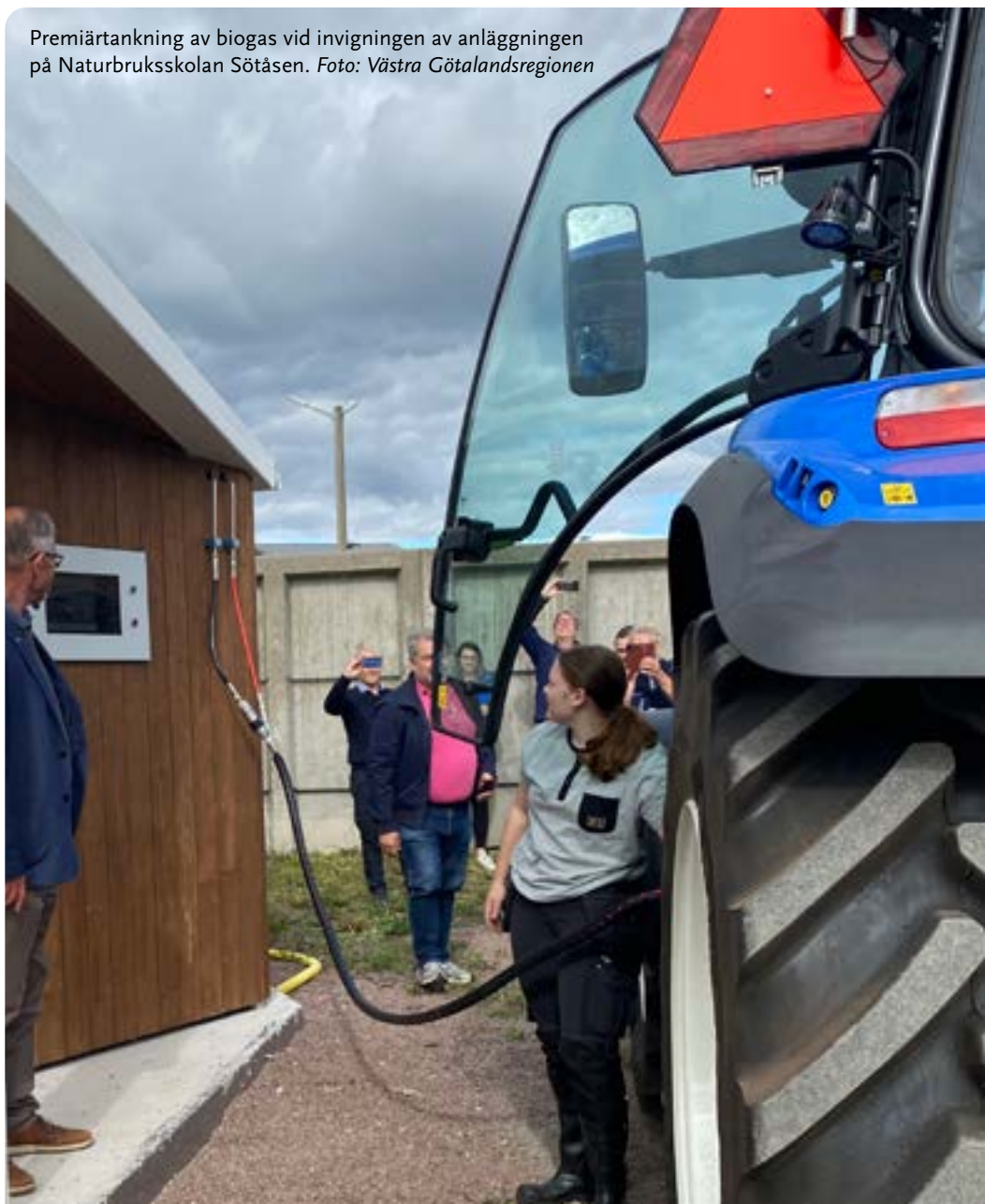
Premiärtankning av biogas vid invigningen av anläggningen på Naturbruksskolan Sötåsen.