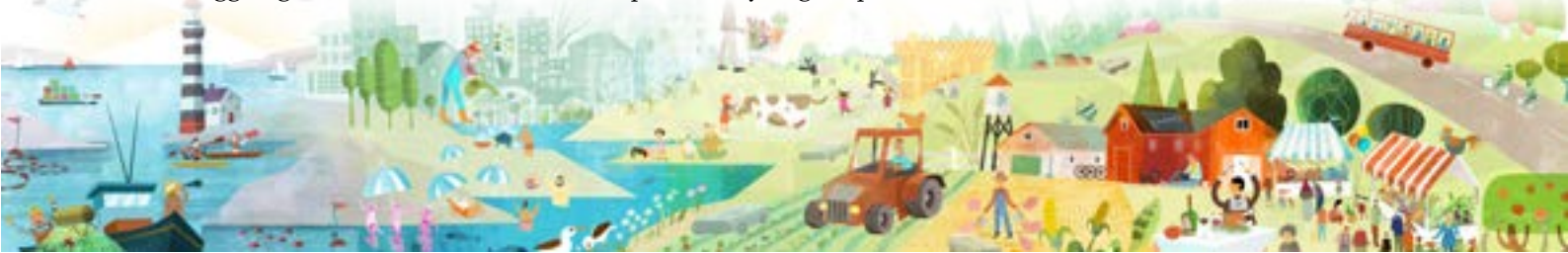
Illustration: Rebecca Elfast