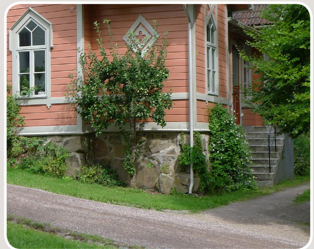
Murad grund.

Växter trivs i ett varmare och fuktigare klimat. På fasader har olika typer av påväxt en större chans att få fäste. Alger, mossor och lavar skadar inte byggnadskonstruktionen direkt, men de bidrar till att hålla kvar fukt mot fasaden som i sin tur kan leda till andra fuktrelaterade problem. Även träd och buskar omkring byggnaden kan ställa till med problem genom att hålla kvar fukt och förlänga upptorkningsprocessen.