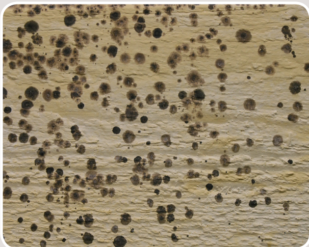
Svartmögel på fasad, Foto: MYCOTEAM

Svartmögel uppträder som små mörka prickar på fasader där luftfuktighet och temperatur varit gynnsamma. Svartmögel har ingen direkt nedbrytande effekt men är inte önskvärd ur estetisk synvinkel. Speciellt tydligt är det på ljusa fasader.