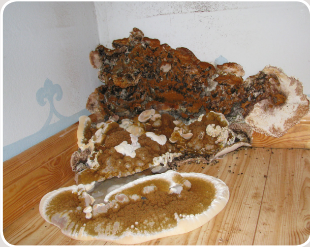
Angrepp av äkta hussvamp i golv