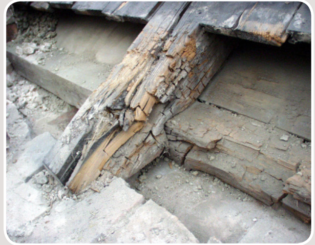
Brunröta vid takfot, Foto: MYCOTEAM

Brunrötesvampar är de vanligaste rötsvamparna i hus. Ett angrepp känns igen på att träet spricker upp i ett kubliknande mönster och färgas brunt. Det finns flera olika brunrötesvampar. Särskilt allvarligt är angrepp av äkta hussvamp eftersom den själv kan tillföra fukt och därför växer snabbt. Vitröta angriper främst virke av lövträ. Vitrötan gör träet poröst och får