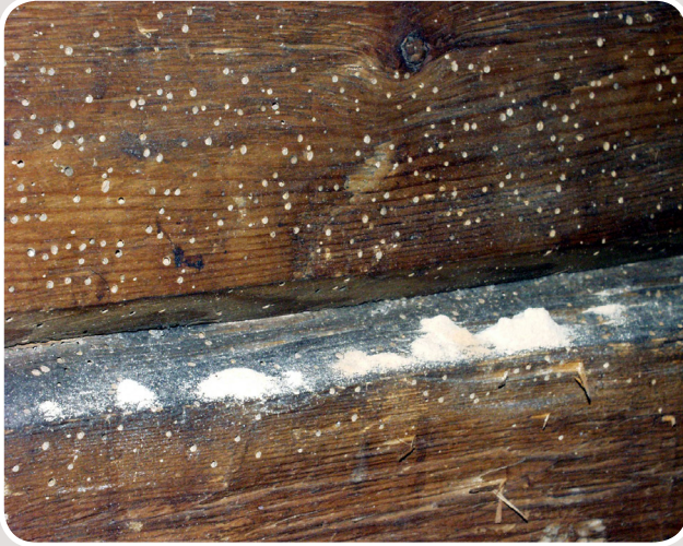
Utflygningshål av strimmig trägnagare