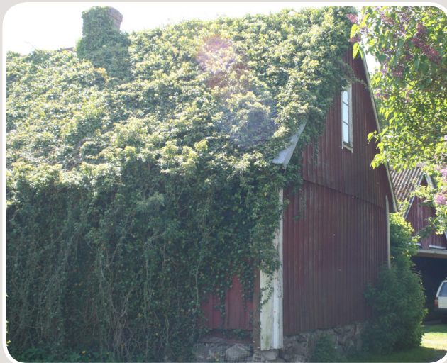
Träd över tak, Foto: Länsstyrelserna

Husbock och strimmig trägnagare är två exempel på skadedjur. Även hästmyran kan ställa till med skador i byggnader. Den kan bygga bo i rötskadat virke, och därifrån sprida sig till friskt material. Skadedjur kan äventyra byggnadens konstruktion och stabilitet, speciellt om angreppet skett i bärande delar.