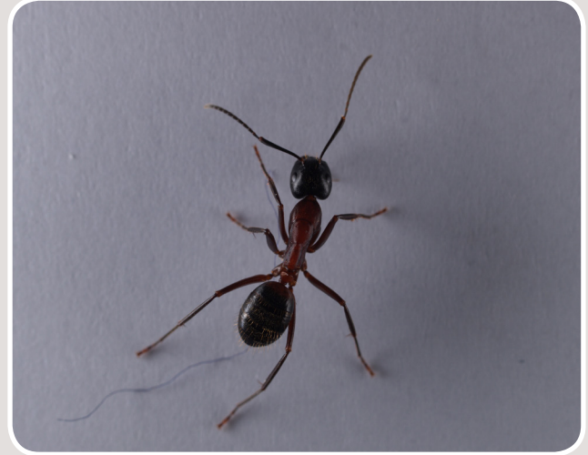
Hästmyra, Foto: MYCOTEAM

Insektslarver som livnär sig på att äta trä kan angripa byggnader där de gräver gångar i virket. De trivs i fuktigt trä där de lever tills de är fullvuxna och flyger ut. Detta bildar små hål i träytan. Upptäcks sådana hål är det en indikation på att man har larver i byggnaden.