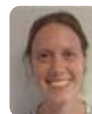
Mien de Voeght Enheten för jordbrukarstöd