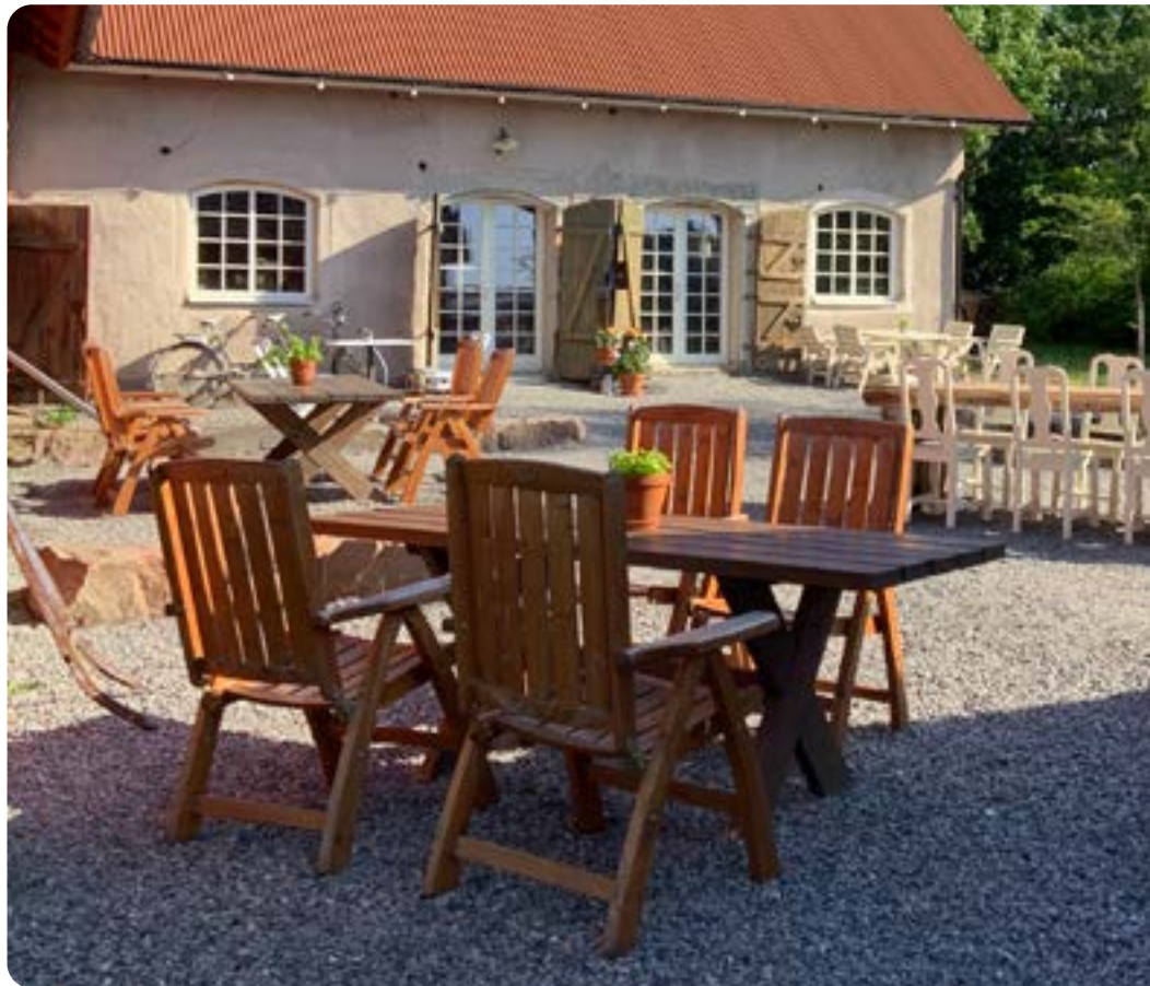
▲ På Vedens Lustgård har företagarna byggt om den tomma ladugården till en pizzeria.

Numera så har det blivit två olika verksamheter som finns i två aktie-