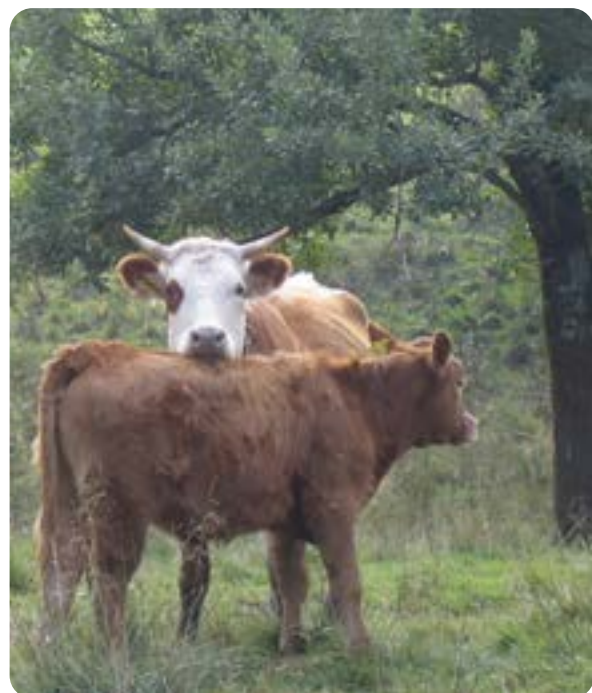
▲ Rätt djur på rätt plats – något att arbeta aktivt för.