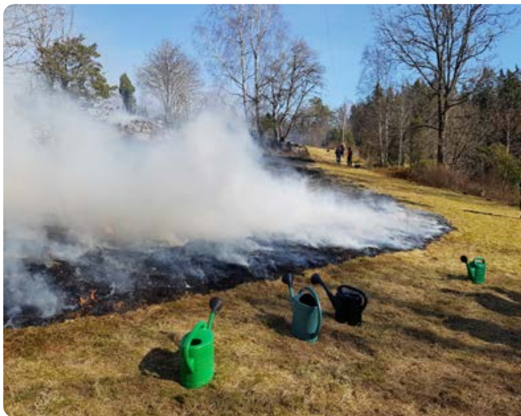
▲ En slagen och vattnad brandgata gör att elden stannar snabbt.